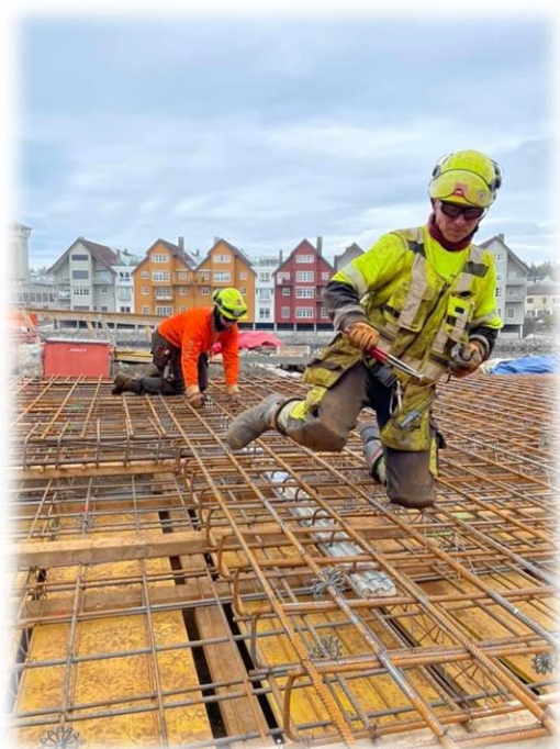
To av våre dyktige fagarbeidere i godt driv!

Vi anbefaler alle å ta turen innom https://www.trondertv.no/prosjekt-jakob .