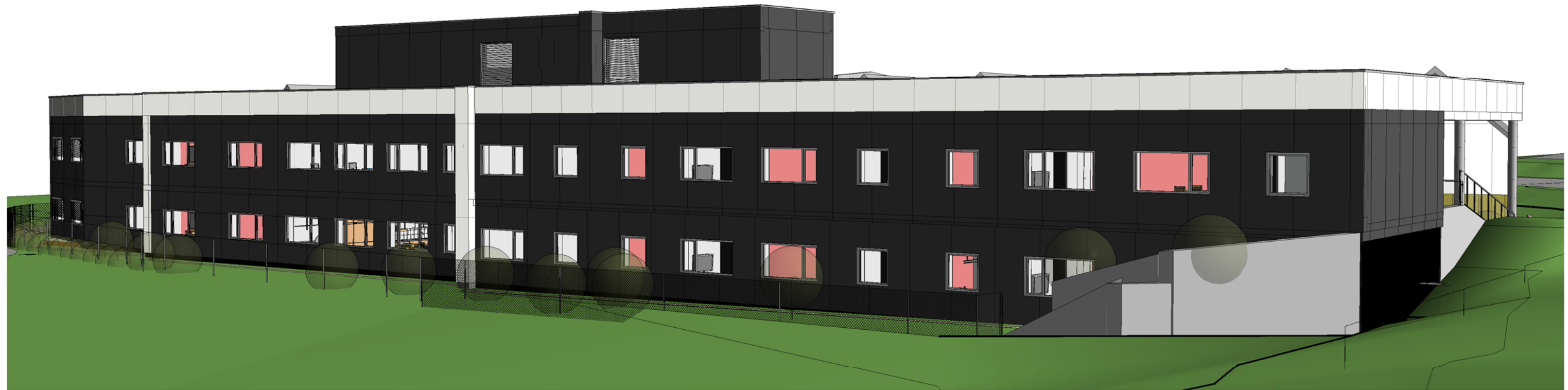
A91-01 3D Fasade Nord øst